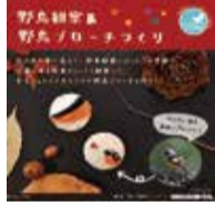
左記のかわいい案内は、昨年冬に開催した、むさしのカレッジの講座『野鳥観察&野鳥ブローチづくり』。野鳥観察をした後に羊毛ブローチを作りました。今年度の講座はまだ未定ですが、ホームページや公園内のサービスセンターでお訪ね下さい。