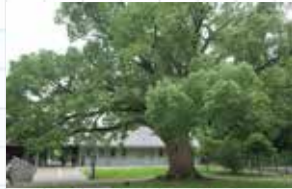
サービスセンター前のクスノキは推定樹齢120年ほど。長い年月の間、前身のゴルフ場だった頃は勿論、広大な飛行場だったことを見つけていたはずですね。