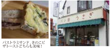
バstromiサンド、きのこピザトーストどちらも美味!

西武多摩川線多磨駅の改札を出て踏切を渡って直ぐ、今年でオープン11年目を迎えるパン屋うさぎ。「こだわりが無いのがこだわりです」とこやかに言うオーナーさん。天然酵母パンあり、国産小麦パンありの、実はめっちゃくちゃ丁寧なパン作りをされています。バリエーションも豊富で、洋風惣菜パンからあんぱんまで曜日によっては動物パンなども楽しめます。パンを持って公園ランチはいかがでしょう。 東京都府中市朝日町 2-30-10 TEL.042-361-6524 【営業時間】10:00 ~ 18:00 営業時間・定休日は変更となる場合がございますので、ご来店前に店舗にご確認ください。【定休日】毎週木 日 祝