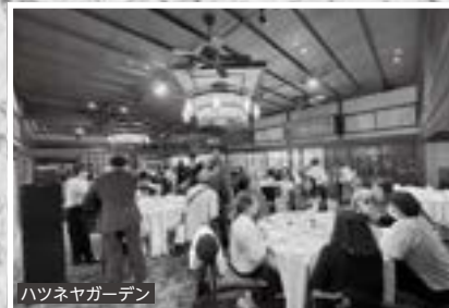
ハツネヤガーデン

他にも本場台湾・中国道教の雰囲気の色濃く感じる五千頭の龍が昇る聖天宮や、創業230年の歴史を誇る金笛醤油パークにて木桶仕込みの工房を見学しました。最後にはサイボクハムにて直営工場から届いた新鮮なお肉を購入し、最後まで皆様にご満足いただける旅となりました。