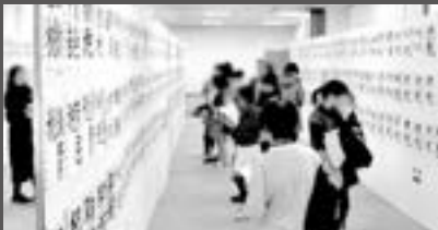
小学生の税の書道展

武蔵府中青色申告会は、昭和40年に設立されました。府中市・調布市・狛江市を中心とする個人事業主の方々の記帳・決算のサポートを行っています。会員数は約6000名以上で、都内有数の規模です。平成22年11月には公益社団法人に移行認定され、親子租税学習ツアー・小学生の税の書道展などの租税教育や、地域のイベントへの参加など、さまざまな啓蒙・社会貢献活動も行っております。