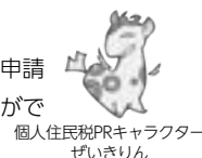
個人住民税PRキャラクター ぜいきりん

※従業員が常時10人未満の場合は、従業員のお住まいの区市町村に申請書を提出し承認を受けることで、年12回の納期を年2回にすることができる「納期の特例」の制度があります。