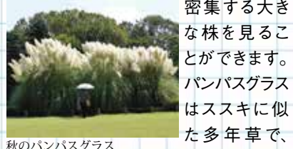
秋のパンパスグラス