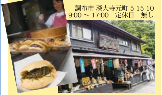
調布市 深大寺元町 5-15-10 9:00～17:00 定休日 無し

深大寺山門に向かって左隣にある「あめや」はその昔、わたあめ屋さんだったことに由来すること。名物深大寺蕎麦に肖って、蕎麦まんじゅう、そばサンド、そばだんご、と目にも楽しい甘味屋さんの一軒です。中でも一番人気の「そばパン」。蕎麦粉を練りこんだふかふかのパンに、つぶあん、高菜、キーマカレー、などがサンドしてある和のファーストフード、食べ歩きもOKです！(250円～)とっても美味しいそばパンのふかふかの出来立てを是非お試しください。