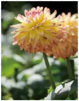
ダリア園は開花が長く楽しめます

現在、約4,500種類、10万本・株の樹木が植えられています。園内はばら園、つつじ園、うめ園、はぎ園をはじめ、植物の種類ごとに30ブロックに分けており、景色を眺めながら植物の知識