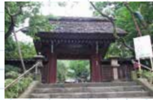
調布を代表する観光名所です。深大寺山門

9月～10月に黄金色の輝きを見ることが出来ます。そして秋咲きのばら園はイチオシです。春に咲くバラとは一味違った秋バラ、空の高さが違うせいでしょうか。是非何度か足を伸ばしたい植物公園です。南側の深大寺門を抜け木陰の続く道を下れば、深大寺のお蕎麦やさんや土産物やさん、そして甘味屋さんが軒を連ね、余すことなく楽しめる深大寺周辺。